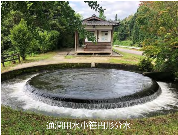
通潤用水小笹円形分水

この円形分水では農地面積の比率によって7：3の割合で2方向に分派され、7割は通潤橋で有名な通潤用水に水を運び、もう一方の3割は野尻・笹原地区へ送水しています。円形分水が完成したおかげで、水争いが解決されたと言われています。